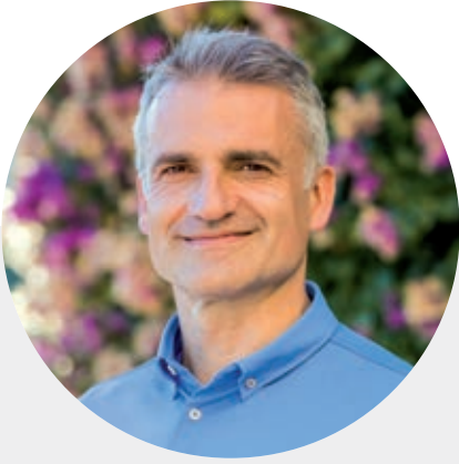
Josep Triadó i Bergés Alcalde de Premià de Dalt