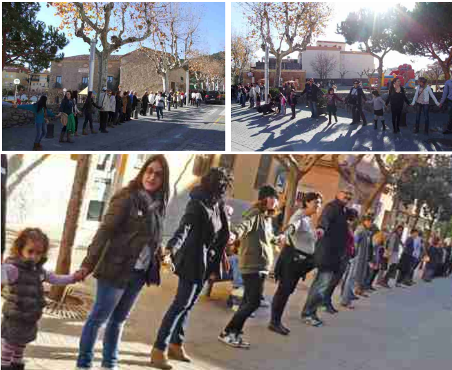
>> Imatges de la cadena al nucli antic i al barri Santa Anna – Tió

Diumenge 16 de desembre, en el marc de la celebració de La Marató de TV3 dedicada enguany al càncer, 1200 persones van unir les seves mans amb l'objectiu de formar una cadena als diferents barris de Premià de Dalt, en una acció solidària coordinada per la secció local d'Oncolliga en què també van col·laborar els comerços del poble, la Societat Cultural Sant Jaume, Medina Vilalta & Partners i l'Ajuntament.