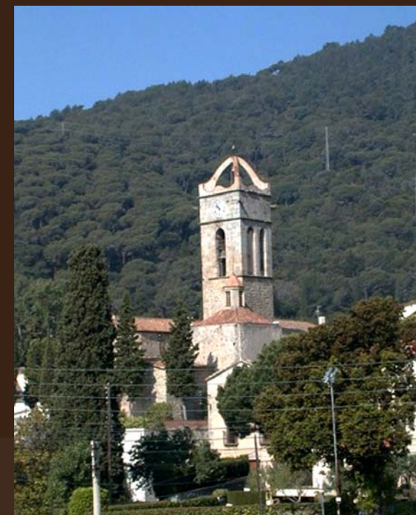
La sagrera medieval i les capelles Premià de Dalt