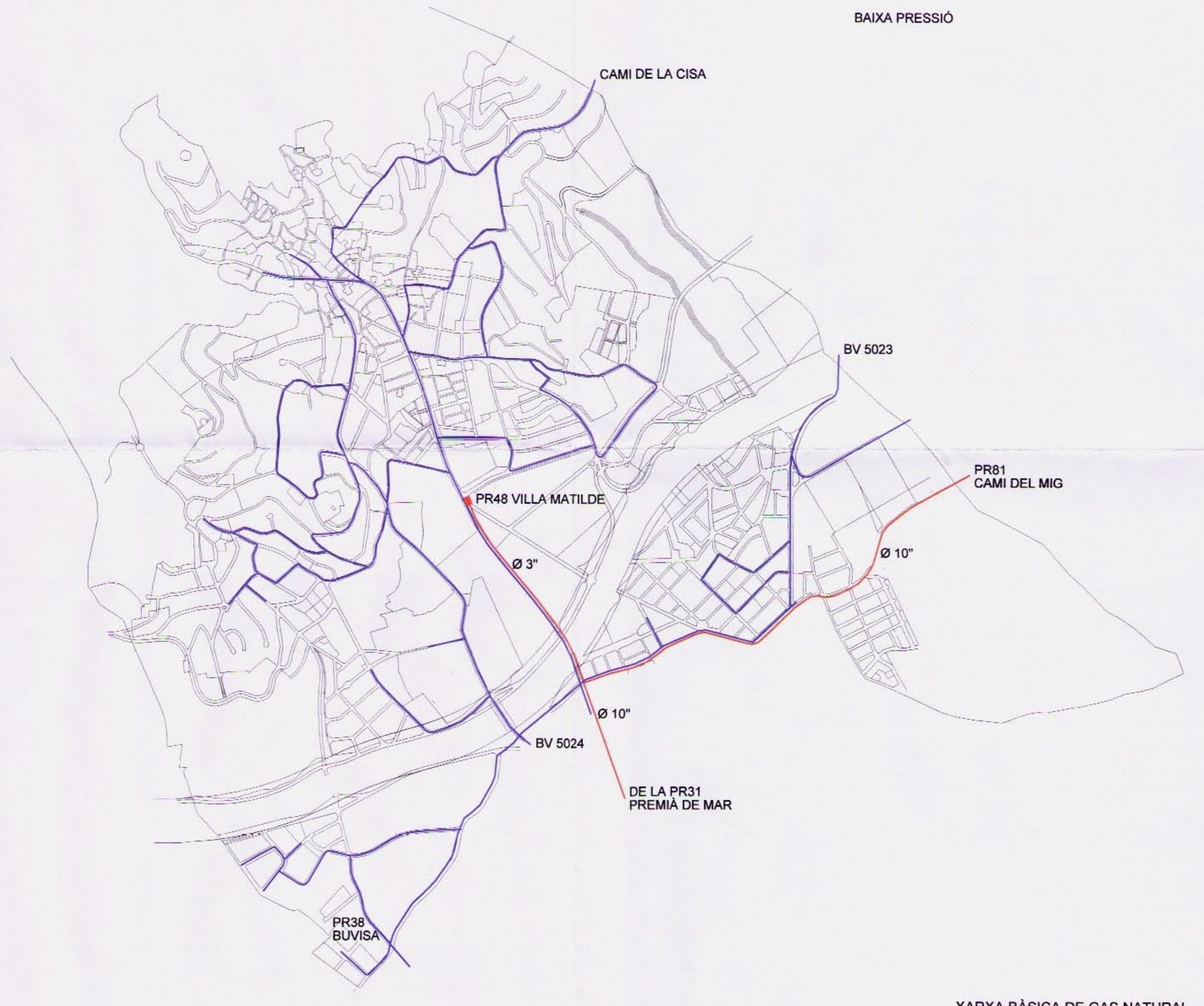
XARXA BÀSICA DE GAS NATURAL ANELLS I RAMALS BÀSICS E : 1 / 10.000