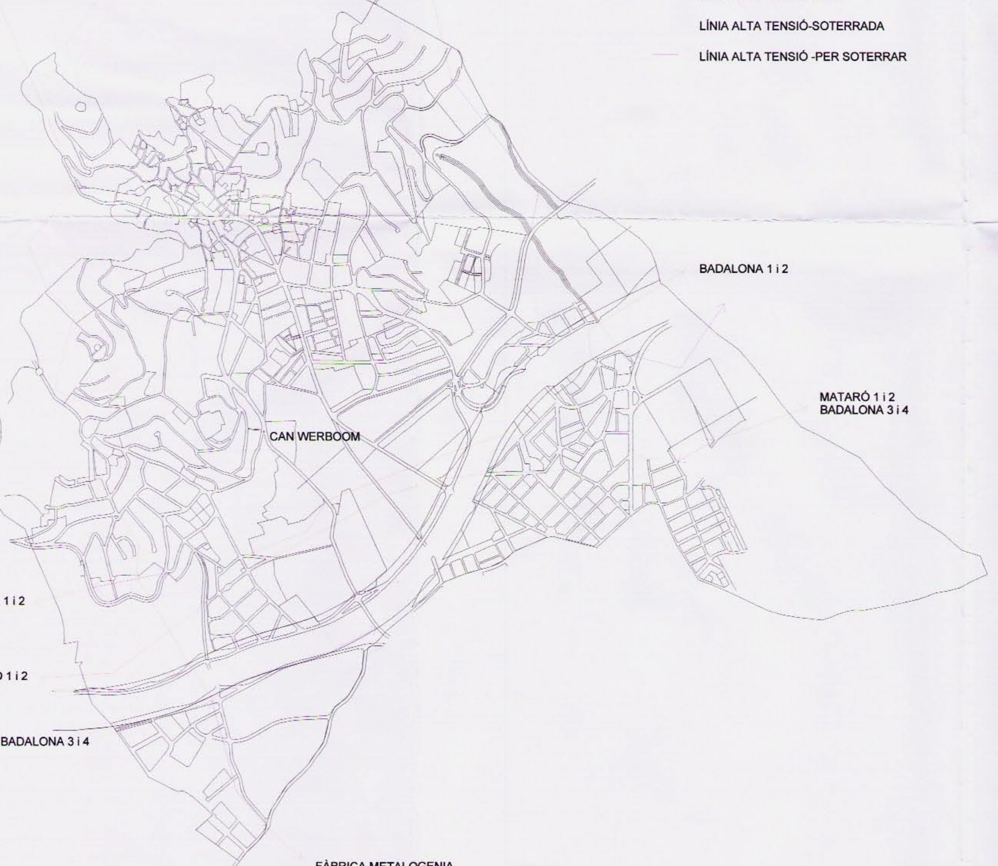
XARXA BÀSICA ELÈCTRICA D'ALTA TENSIÓ E : 1 / 10.000