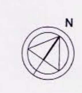
XARXA BÀSICA ABASTAMENT D'AIGUA E : 1 / 10.000

Ajuntament de Premià de Dalt REGISTRAT GENERAL 18 MAIG 2007 Entrada núm. 1231